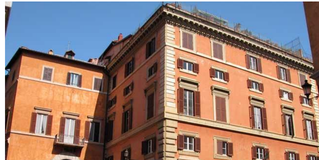
Palazzo Capranica (EF Roma) Roma 11 Febbraio 2023