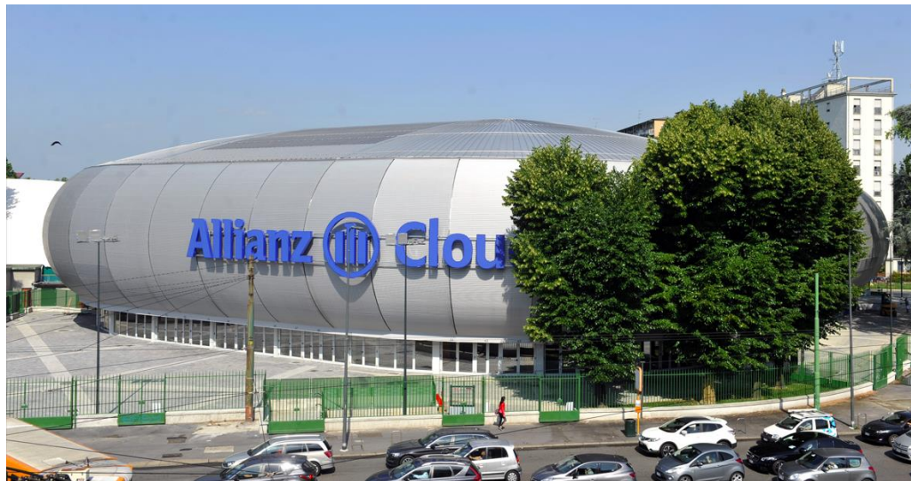
Allianz Cloud Arena Milano 4 Febbraio 2023