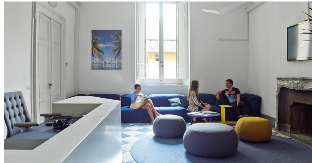
EF Roma Roma 11 Febbraio 2023