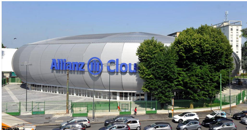
Allianz Cloud Arena Milano 4 Febbraio 2023